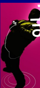
スーツ系腰リール 牛尾 剛氏