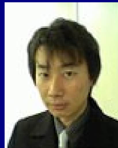
西日本腰リール ユーザーグループ 保守党幹部

このような素晴らしい腰リールを決して広めることなく、秘密の道具箱の一つとして、メリットを享受しようじゃありませんか。Keep on Reelin'.